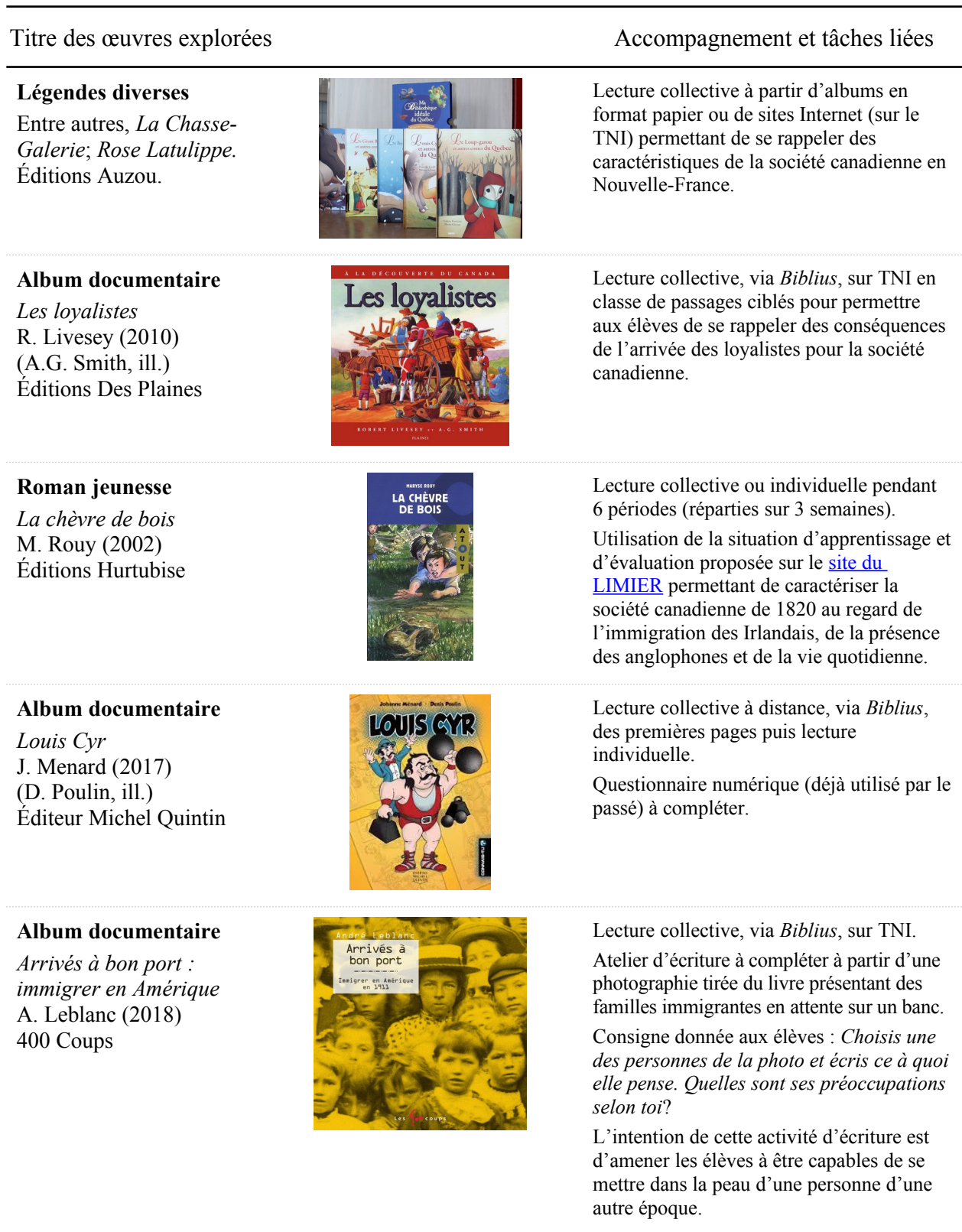
Tableau 1. Œuvres de littérature pour la jeunesse explorées par l'entremise de Biblius