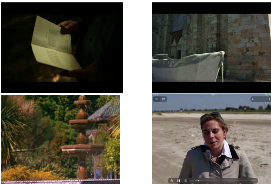
Illustration 6 : Captures de vidéos extraites de l'édition enrichie de La Croisade des enfants (entretiens avec des spécialistes de littérature médiévale)