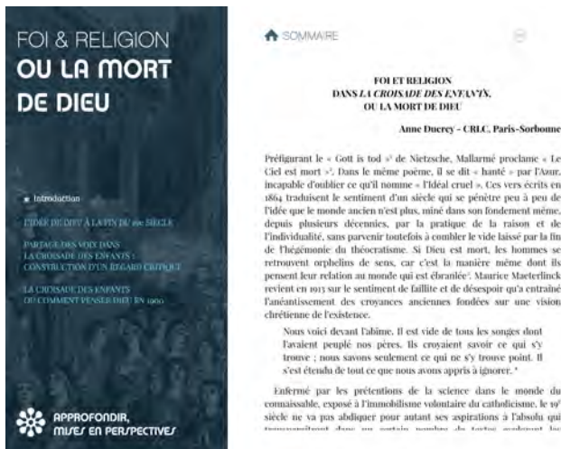
Illustration 5 : Parcours « Approfondir, mise en perspective » (extrait de l'édition enrichie)

Le troisième parcours invite à une démarche d'approfondissement par la découverte du point de vue de chercheurs spécialistes de différents domaines et périodes, à travers des articles enrichis d'illustrations et de sons, mais aussi d'interviews vidéos. Ces détours, étayages ou expansions scientifiques ne sont pas opposés au plaisir de la mise en scène, au jeu avec les sons, les images et la sémiotique générale de l'outil.