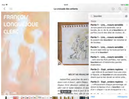
Illustration 10 : Fonctionnalité de recherche plein texte (extrait de l'édition enrichie)

Enfin, la publication numérique facilite l'analyse des échos lexicaux, le développement de compétences d'analyse intratextuelle, grâce à la navigation via le sommaire, mais surtout la recherche plein texte qui permet de repérer les occurrences d'un mot. C'est particulièrement intéressant dans ce texte tissé de répétitions, qui ont différentes fonctions. Prenons ainsi l'exemple du mot « bourdonner » qui vient faire écho aux « bourdons » des pèlerins.