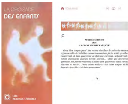
Illustration 9 : Captation vidéo montrant la continuité iconographique des chapitres (extrait de l'édition enrichie)

D'autre part, l'édition numérique peut encourager la perception et l'analyse de l'énonciation littéraire. On peut souligner l'intérêt de la lecture sonore sur ce plan : les voix incarnent les personnages, mais sans chercher à trop singulariser chacun d'entre eux, sans trop appuyer le trait. Ce choix correspond à l'écriture de Schwob, dans laquelle il y a à la fois une singularisation du discours de chaque protagoniste (le lépreux, le goliard, les enfants, les papes, le kalandar) et en même temps une certaine continuité, une homogénéité de l'ensemble des récits organisés de façon linéaire, structurée vers la fin du récit.